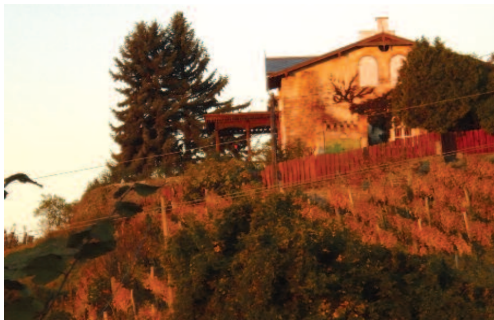
A badacsonyi villa, itt szüretelt Nagy Imre hatvan évvel ezelőtt, október 23-án

31 éve, 1985. november 6-án költözött végleg virágai közé a legnagyobb magyar növényrajzoló, Csapody Vera. A matematika-fizika tanárnőt 1922-ben kérte fel Jávorka Sándor akadémikus a magyar flóra képekben, az Iconographia Florae Hungaricae illusztrálására. Jávorka egy akvarelljeiből készült kiállításon ismerte fel Csapody növényrajzoló tehetségét, aki továbbra is változatlanul tanított, de ettől kezdődően tanári munkája mellett érdeklődése a növényi ábrázolás felé fordult. 1916-tól a Sacre Coeur Sophianum katolikus leánygimnáziumban (1914-ben alakult Budapesten, a kolozsvári után másodikként) tanította a matematikát és a fizikát. 32 évig