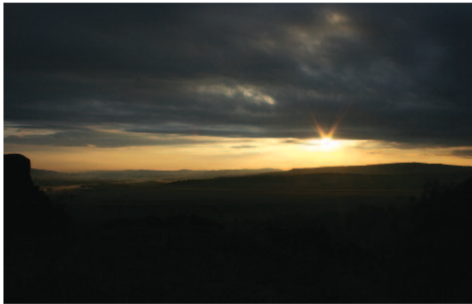
A fogyó fény alig egy ujjnyi fenn s a táj csendje oly mély, hogy szinte zengő

Kelt 2016-ban, az '56-os forradalom levereése után hatvan évvel