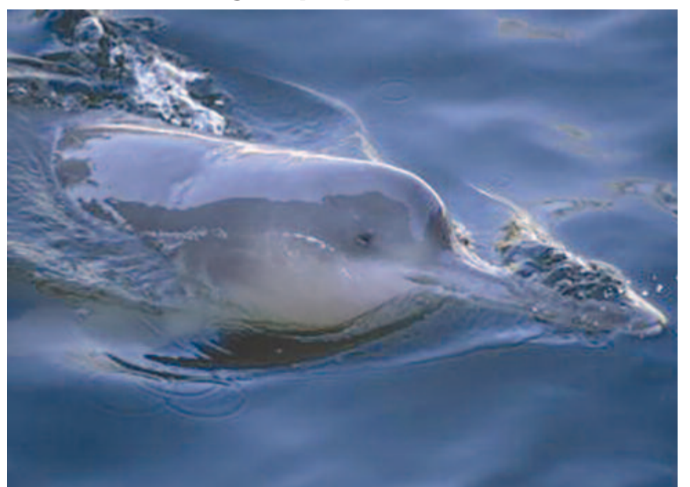
Mára már kihalt a kínai édesvízi delfin