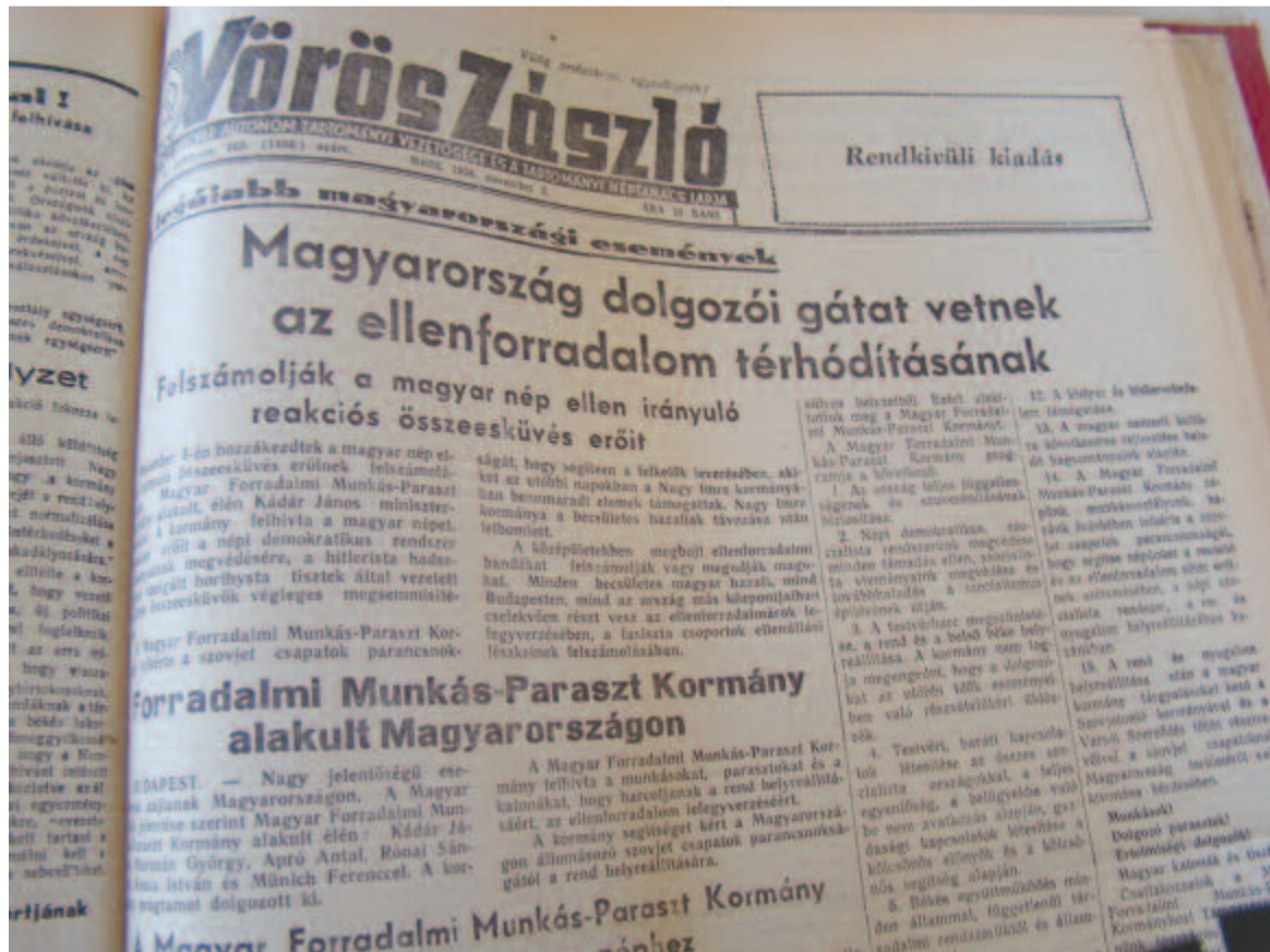
Vörös Zászló, 1956. november 5.