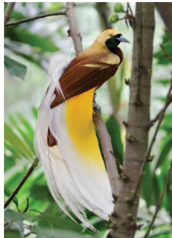
Kis paradicsommadar www.offorever.blog.hu

A nyereségvágyó idegenek oly sokat felvásárolnak a színpompás tollakból, hogy már-már veszélybe sodorták az állományt. Dürgéskor egyszerre 20-30 színes hím gyűl össze a nagy fákon, és egymástól távol eső ágakat cupaszítanak meg a levelektől. Pompázó tollazatukat messziről látják a tojók meg a pápuák. A hímek hangos kiáltással is felhívják magukra a figyelmet. Egyik ágról a másikra repülnek, szárnyukat kitarják, a reggeli, déli, délutáni napfényben egyszerre, ütemesen mozgatják le-fel aranyosan csillogó tollpamataikat. Minden fajuknak erős a lába. Ha az élelemszerzés megkívánja, fejével lefelé is biztosan tudnak kapaszkodni az ágakon.