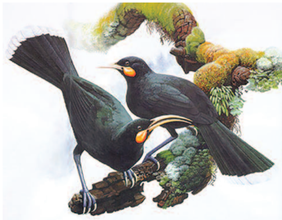
Az Új-Zélandon élő huja 1907-re kihalt

index – amelyet a WWF 18 éve vizsgál – a változás átlagos ütemét mutatja, nem egyenlő az állatok egyedszámának eltűnésével, hanem a populációk méretének csökkenését jelenti. Több mint 3 ezer forráson alapul a jelentés, amelyet két évente adnak ki, és az 1970-es adatokhoz viszonyítanak. A jelenlegi jelentés 2012-ig vizsgálja az adatokat és csaknem 300 hiteles kutatási jelentésre támaszkodik, hat szervezet munkáját mutatja – tette hozzá. Kiemelte: 58 százalékos a visszaesés több mint 14 ezer populáció vizsgálatánál, ez azt jelenti, hogy 58 százaléka tűnt el ezeknek az állatoknak. Ez a tendencia, ha nem vál-