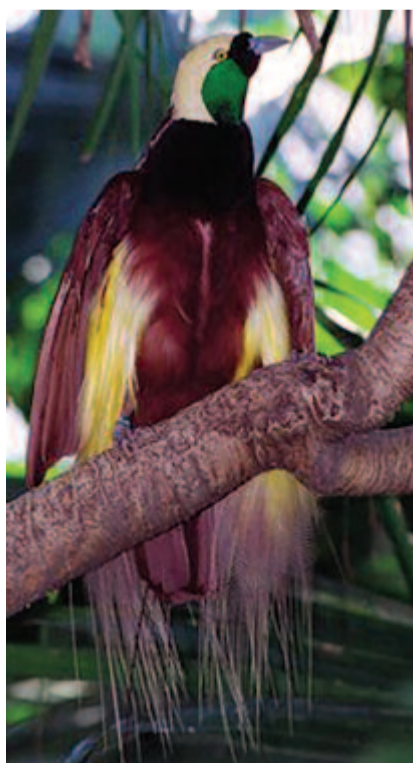
Nagy paradicsommadar